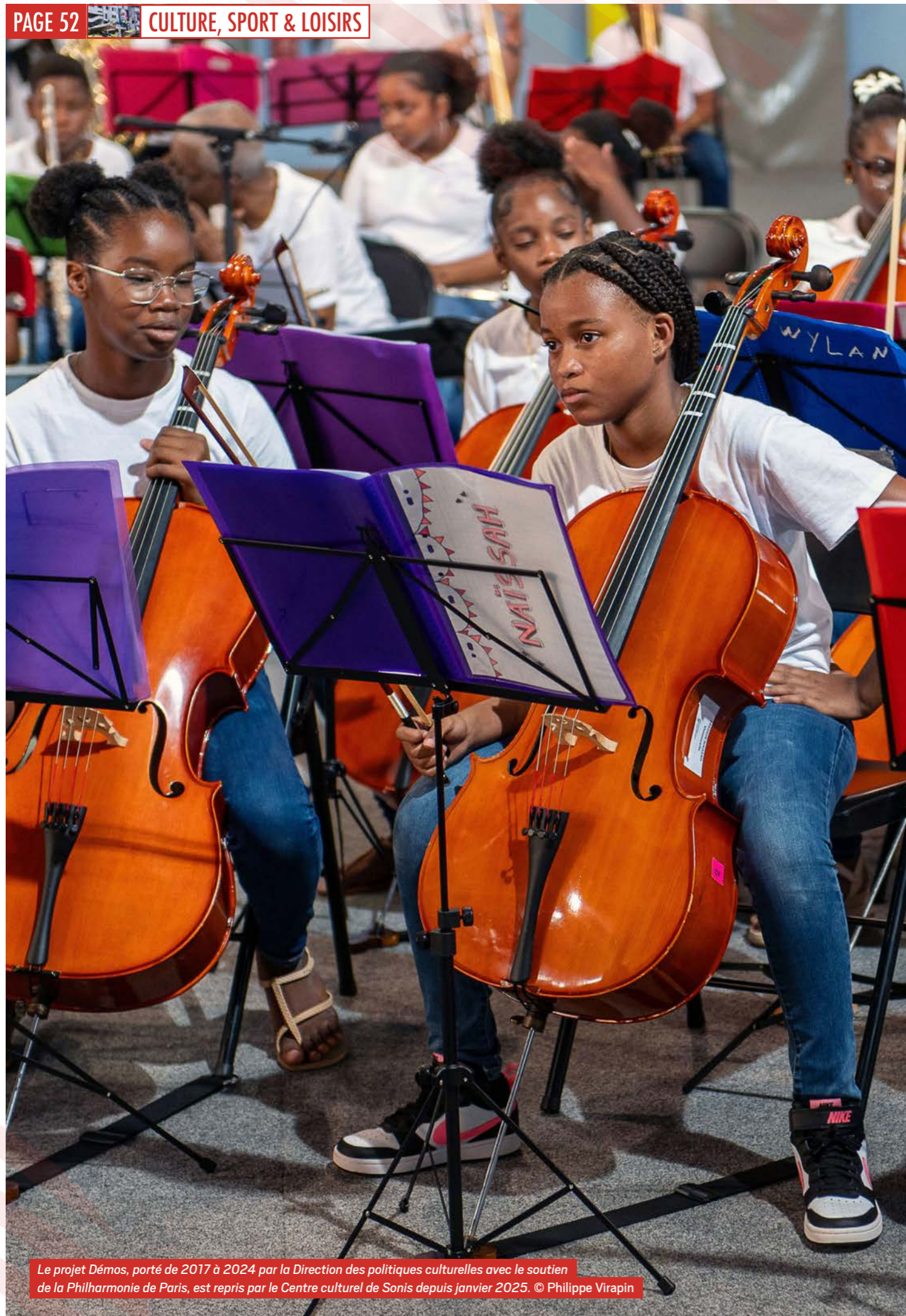
Le projet Démos, porté de 2017 à 2024 par la Direction des politiques culturelles avec le soutien de la Philharmonie de Paris, est repris par le Centre culturel de Sonis depuis janvier 2025.