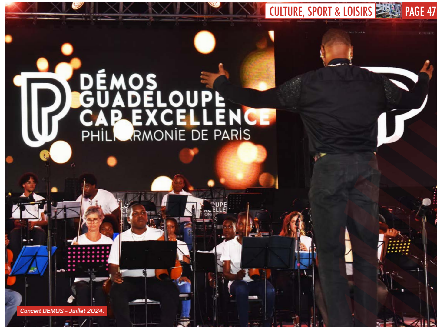
Concert DÉMOS - Juillet 2024.