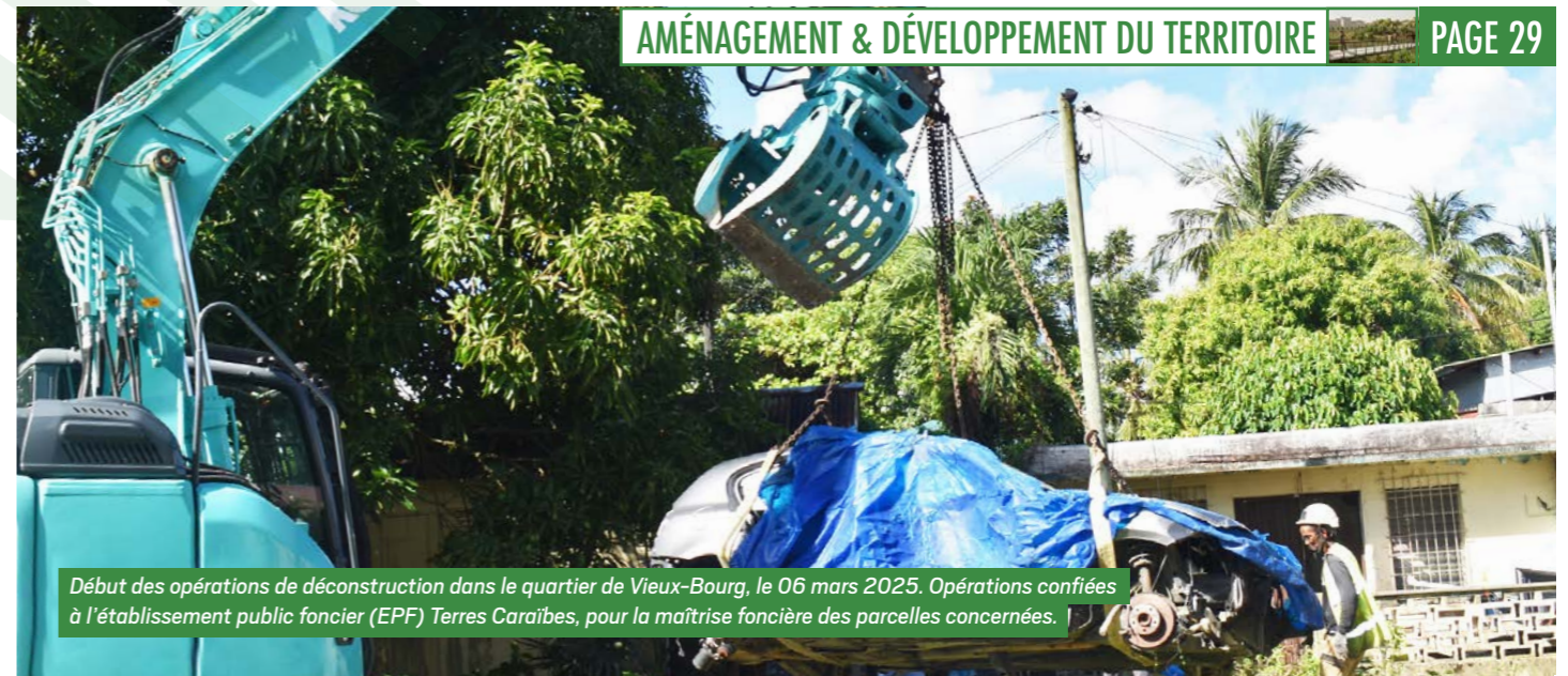
Début des opérations de déconstruction dans le quartier de Vieux-Bourg, le 06 mars 2025. Opérations confiées à l'établissement public foncier (EPF) Terres Caraïbes, pour la maîtrise foncière des parcelles concernées.