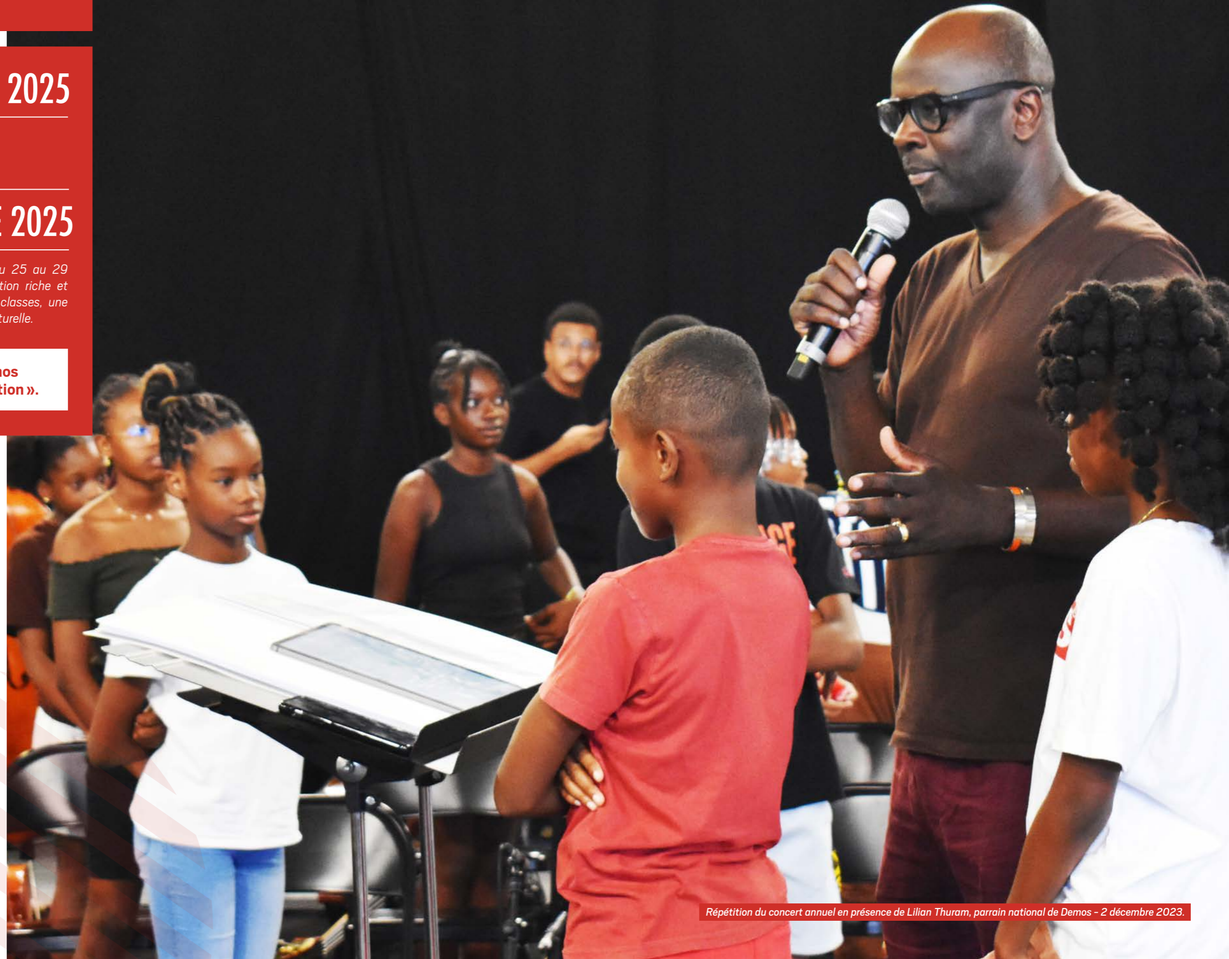
Répétition du concert annuel en présence de Lilian Thuram, parrain national de Demos - 2 décembre 2023.

« La culture, c'est donner du sens à nos expressions et à notre capacité de création ».