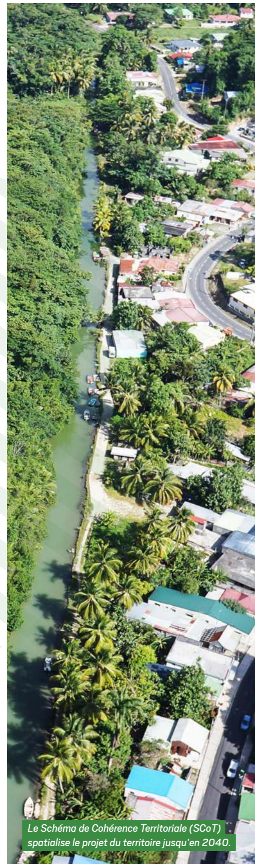
Le Schéma de Cohérence Territoriale (SCoT) spatialise le projet du territoire jusqu'en 2040.

Cap Excellence mise sur l'intelligence collective pour réinventer son territoire : démocratie participative moteur, économie résiliente et inclusive, prospective ambitieuse. Un modèle caribéen de développement durable à l'œuvre.