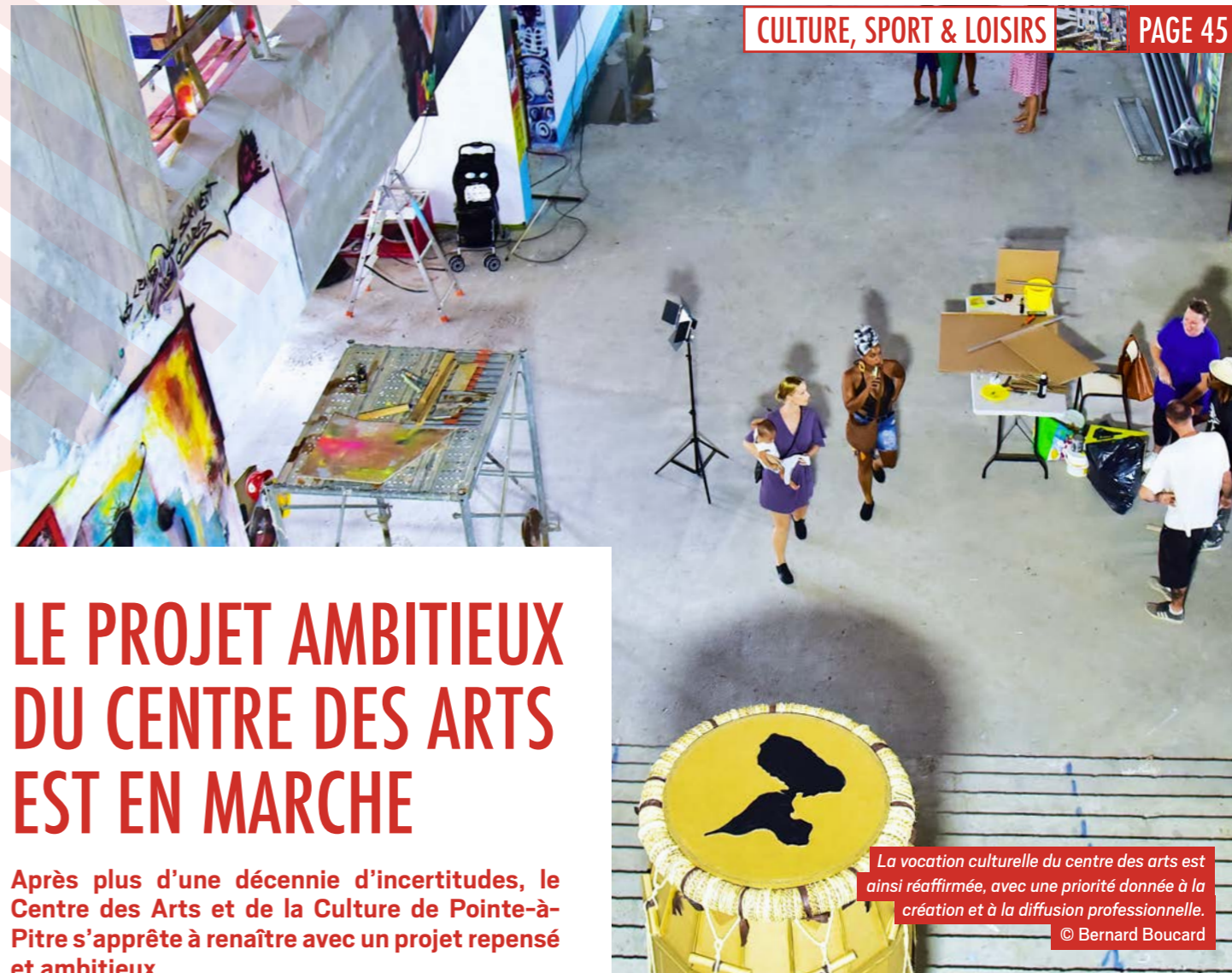
La vocation culturelle du centre des arts est ainsi réaffirmée, avec une priorité donnée à la création et à la diffusion professionnelle.