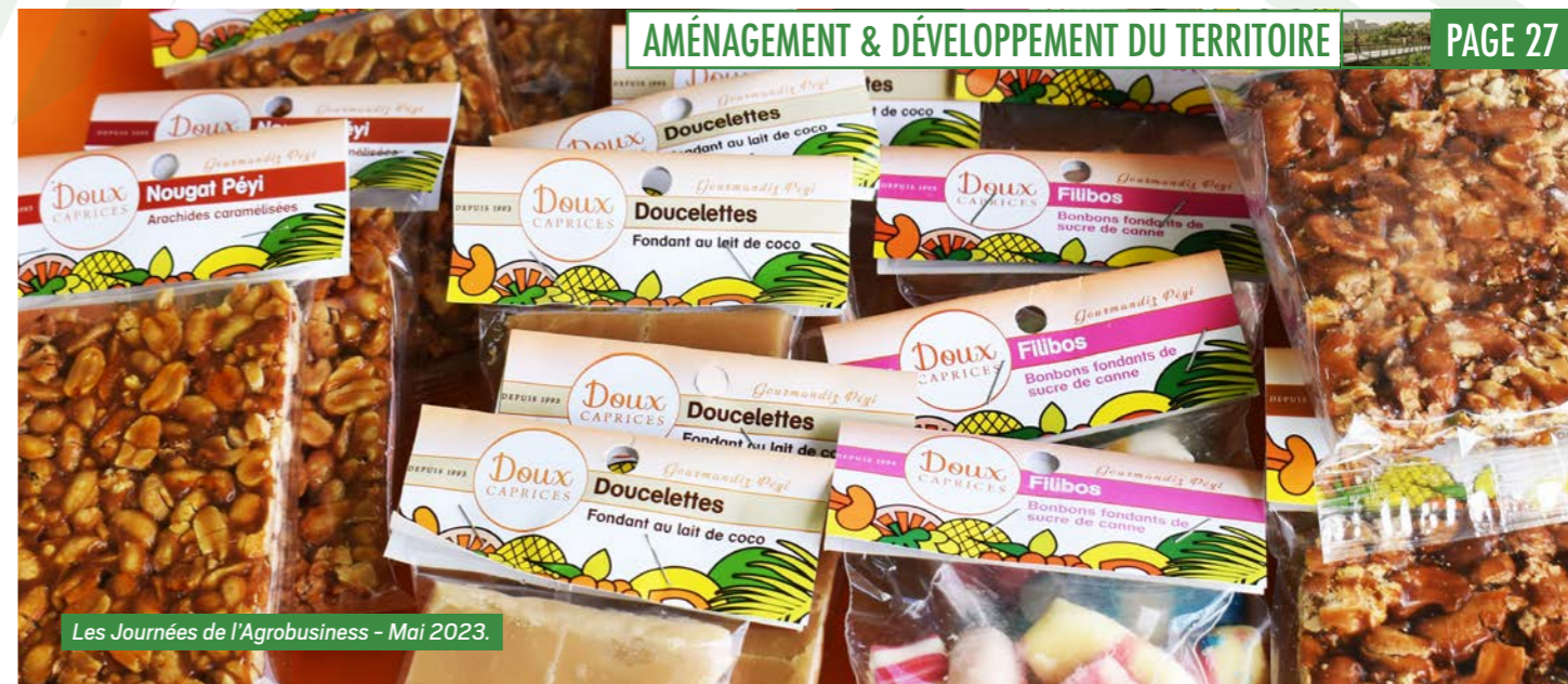
Les Journées de l'Agrobusiness - Mai 2023.