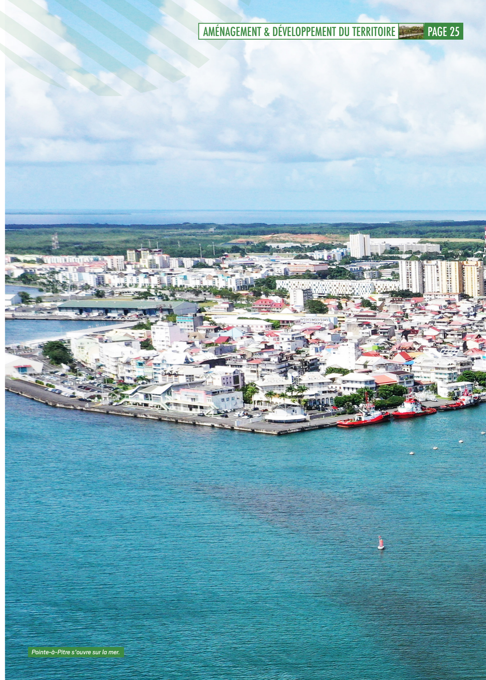
Pointe-à-Pitre s'ouvre sur la mer.

Ce qui émerge, c'est l'esquisse d'une métropole caribéenne résiliente : une économie diversifiée créatrice de sens, un cadre de vie préservé grâce à une gouvernance ouverte, et surtout, une communauté d'acteurs fiers d'écrire ensemble leur avenir. Le pari est audacieux, mais la méthode transparente, inclusive et pragmatique pourrait bien faire école. ■