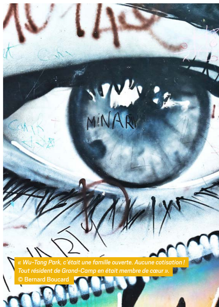
« Wu-Tang Park, c'était une famille ouverte. Aucune cotisation ! Tout résident de Grand-Camp en était membre de cœur ».