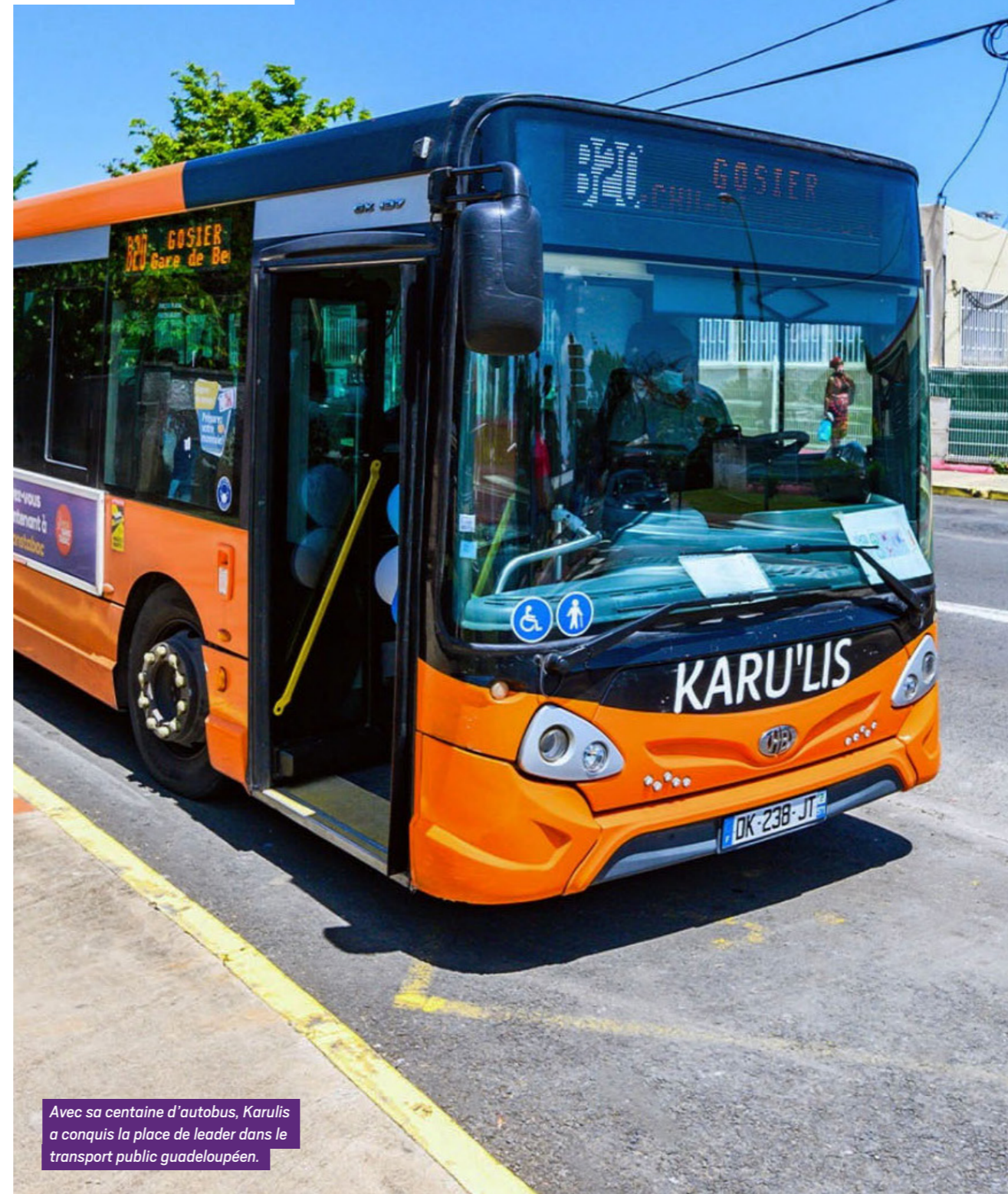
Avec sa centaine d'autobus, Karulis a acquis la place de leader dans le transport public guadeloupéen.

Karulis ne se contente pas d'assurer les déplacements quotidiens. La société joue un rôle crucial dans le transport scolaire avec : 31 marchés spécifiques, 112 lignes dédiées 4 000 élèves transportés chaque jour. Ce volet essentiel de l'activité témoigne de l'engagement de l'entreprise envers les jeunes générations et de son rôle dans l'accès à l'éducation.