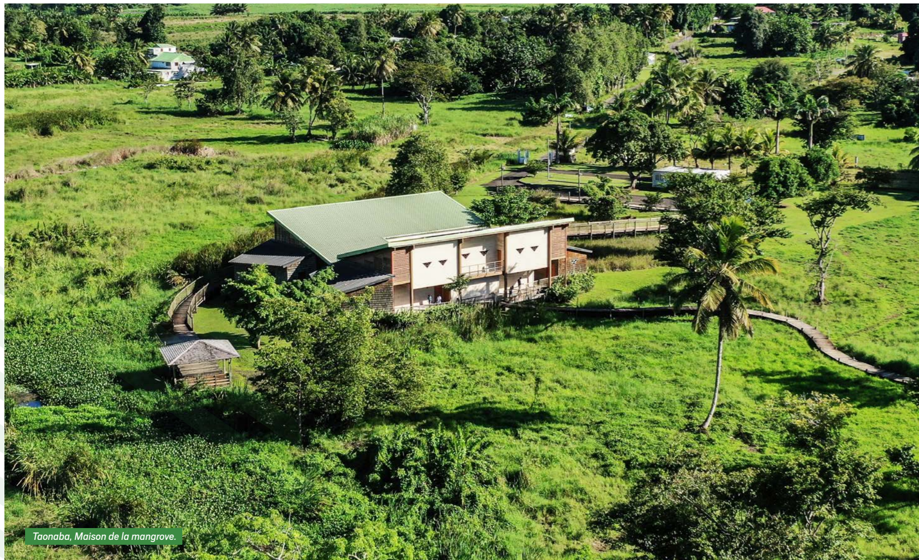
Taonaba, Maison de la mangrove.