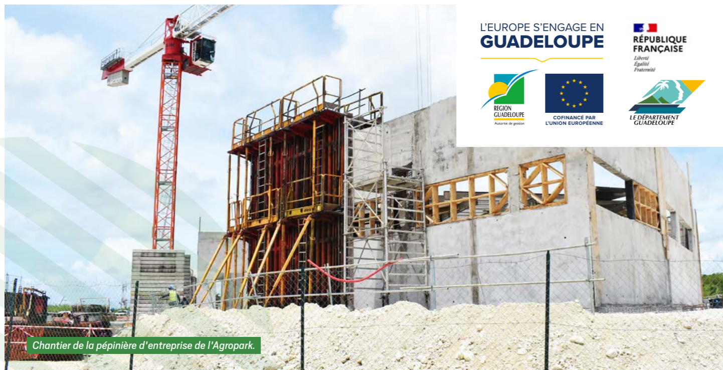
Chantier de la pépinière d'entreprise de l'Agropark.

AGROPARK MISE SUR LA CRÉATION DE VALEUR AJOUTÉE PLUTÔT QUE SUR LA PRODUCTION BRUTE.