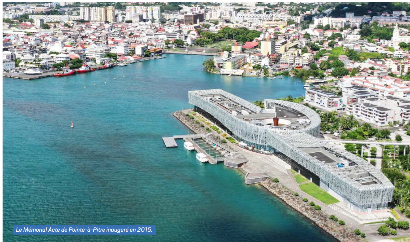
Le Mémorial Acte de Pointe-à-Pitre inauguré en 2015.

Aujourd'hui, Pointe-à-Pitre est une ville en mutation, prête à réaffirmer son rôle dans l'agglomération Cap excellence et dans la Guadeloupe de demain. ■