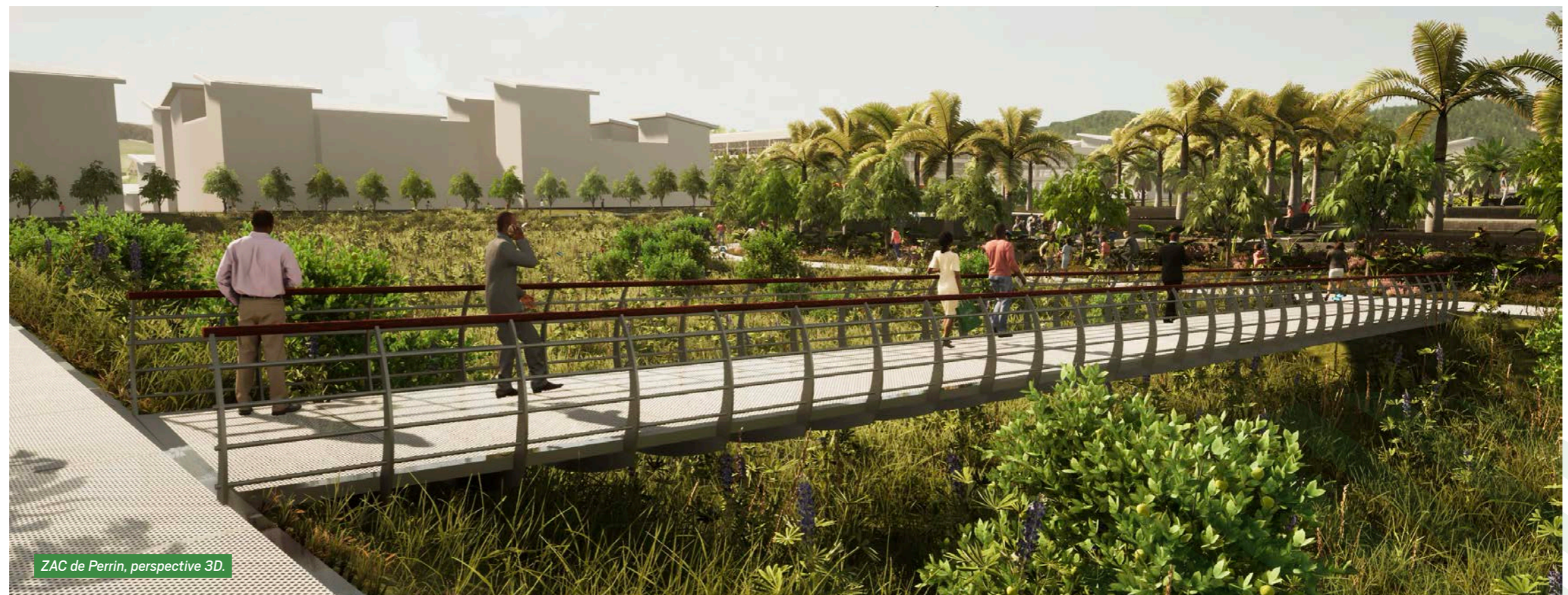
ZAC de Perrin, perspective 3D.