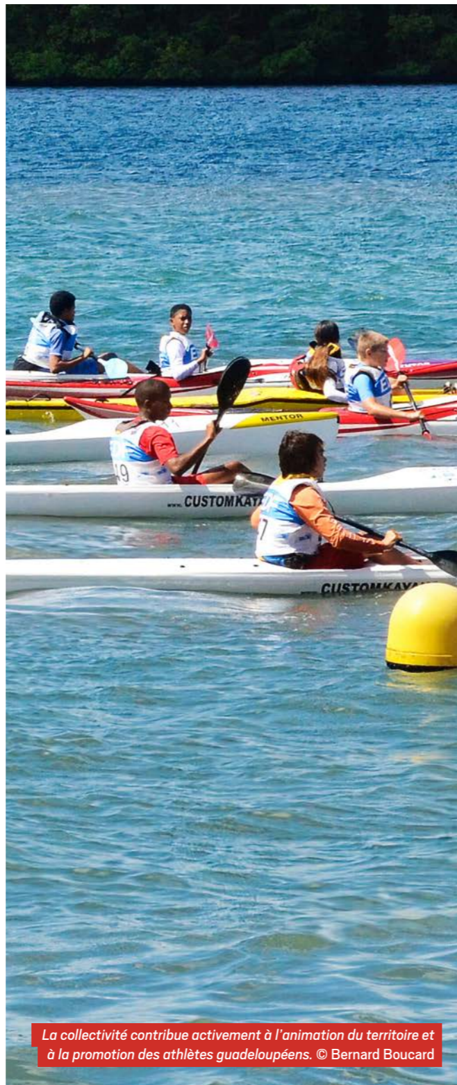
La collectivité contribue activement à l'animation du territoire et à la promotion des athlètes guadeloupéens.

Avec la base Yves Dolmare comme symbole de cette dynamique, CAP Excellence confirme sa volonté de faire du sport un levier essentiel de cohésion sociale et de rayonnement régional. ■