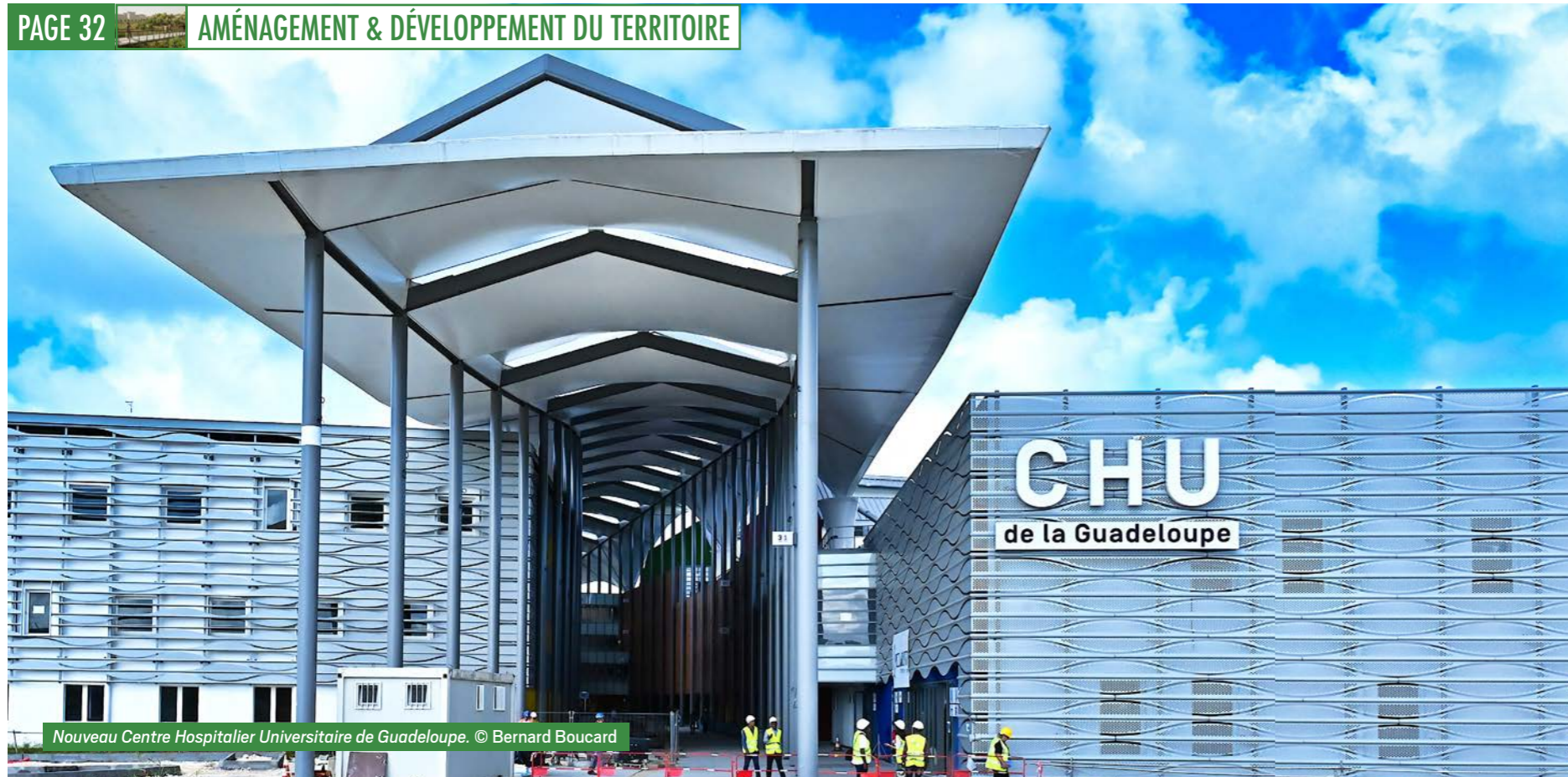
Nouveau Centre Hospitalier Universitaire de Guadeloupe.