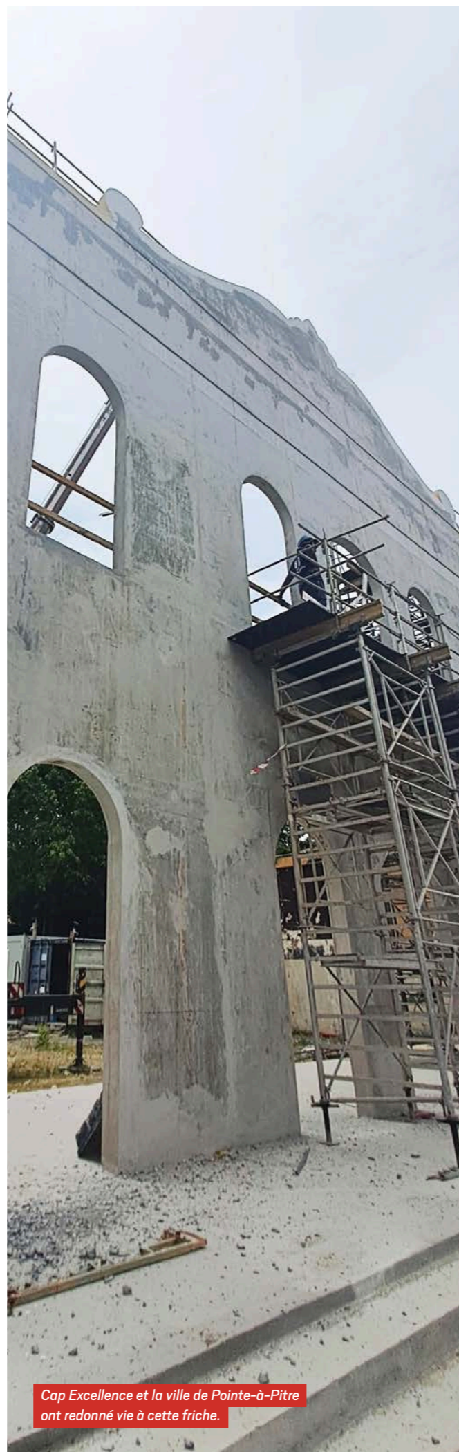
Cap Excellence et la ville de Pointe-à-Pitre ont redonné vie à cette friche.

La Ville de Pointe-à-Pitre, et Cap Excellence tels des démiurges orchestrent cette renaissance. Lorsque les portes de la Renaissance s'ouvriront, ce ne sera pas seulement un cinéma qui renaîtra, mais un morceau d'histoire, prêt à inspirer les rêves de demain. ■