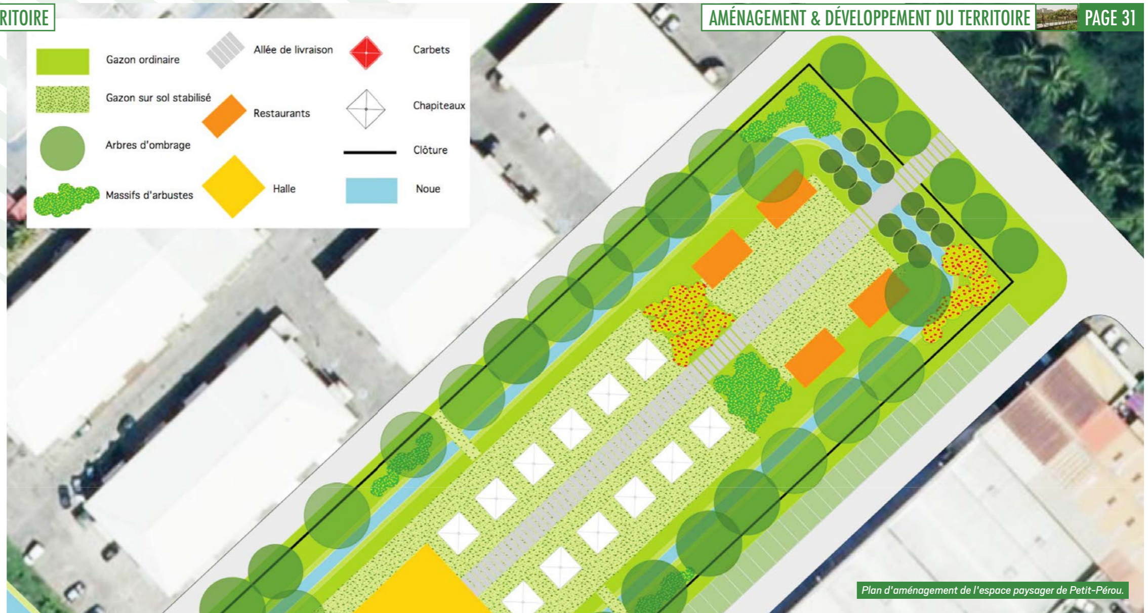
Plan d'aménagement de l'espace paysager de Petit-Pérou.