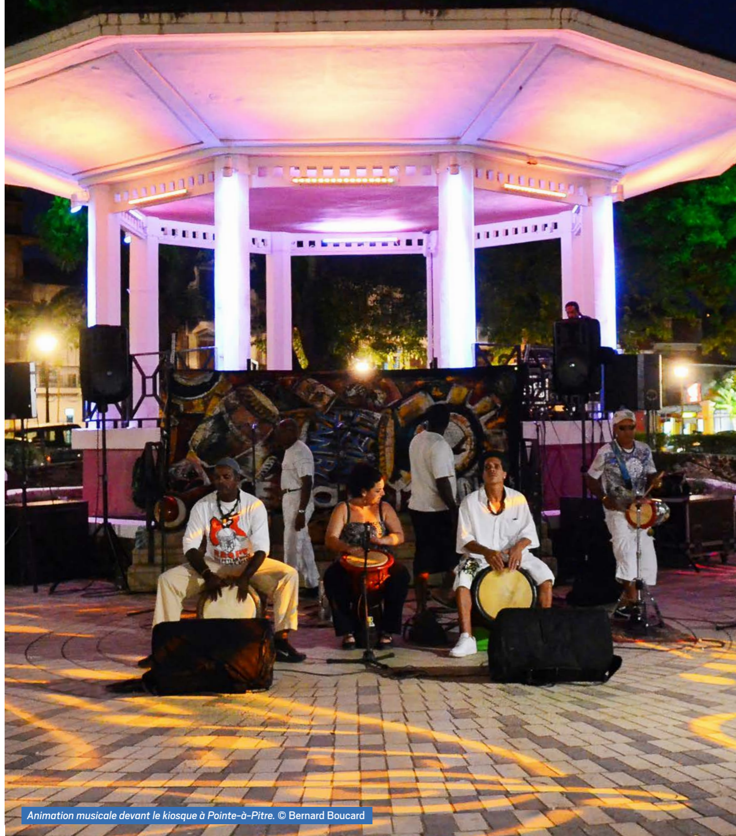
Animation musicale devant le kiosque à Pointe-à-Pitre.

Le kiosque de la place de la victoire à Pointe-à-Pitre a été édifié en 1930 par Gérard-Michel Corbin. C'est le premier ouvrage qu'il construit. Il remplace le kiosque de style Napoléon III détruit par le cyclone de 1928. Premier exemple de l'architecture en ciment armé, cet édifice marque le début d'une ère nouvelle pour l'architecture en Guadeloupe. Le kiosque à musique arbore une architecture simple, aux formes épurées et témoigne du style architectural des années 1930.