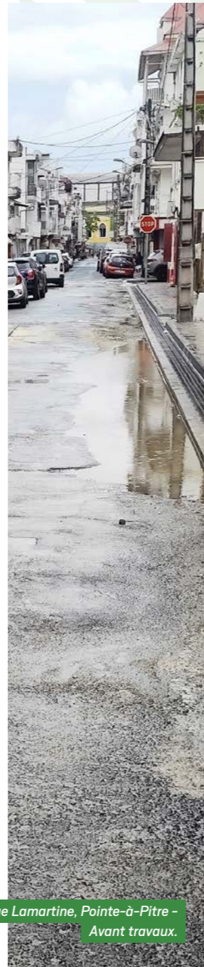
Rue Lamartine, Pointe-à-Pitre - Avant travaux.

Les riverains et professionnels peuvent d'ores et déjà constater les premiers résultats, avec l'ouverture de nouveaux axes et la livraison progressive des aménagements. Un pas de plus vers une ZAE plus compétitive et intégrée dans le paysage urbain. ■