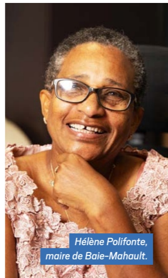
Hélène Polifonte, maire de Baie-Mahault.

Baie-Mahault offre bien plus que son image de centre économique. Nos paysages naturels, tels que le littoral, les mangroves, sont de véritables trésors écologiques. Par ailleurs, notre patrimoine culturel, incarné par nos traditions (notamment l'événement culturel phare autour du bûcher de la Saint Jean) et nos sites historiques, mérite une valorisation renforcée. L'agglomération pourrait mieux mettre en avant ces richesses par des actions concrètes : création de supports de communication dédiés, renforcement de partenariats avec les acteurs touristiques locaux, l'organisation d'événements associant découvertes du patrimoine à des activités culturelles et sportives. Il serait aussi judicieux de mieux connecter nos sites naturels et culturels à ceux des autres villes de Cap Excellence, notamment par la mise en place de circuits touristiques communs. Cette démarche permettrait d'offrir une image plus complète et attractive du territoire de l'agglomération, tout en générant des retombées économiques locales. Il est essentiel que Baie-Mahault soit également reconnue comme une destination où l'on peut vivre des expériences authentiques, au plus près de la nature et de son patrimoine. ■