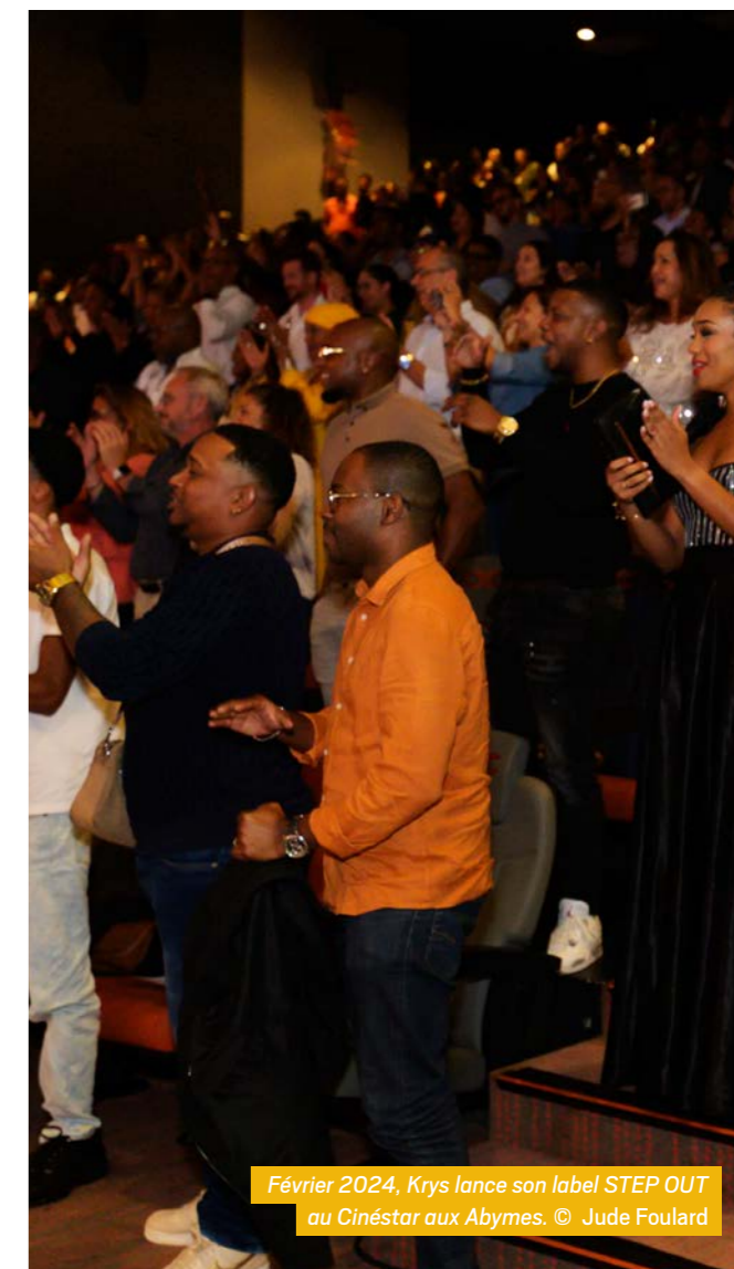
Février 2024, Krys lance son label STEP OUT au Cinéstar aux Abymes.