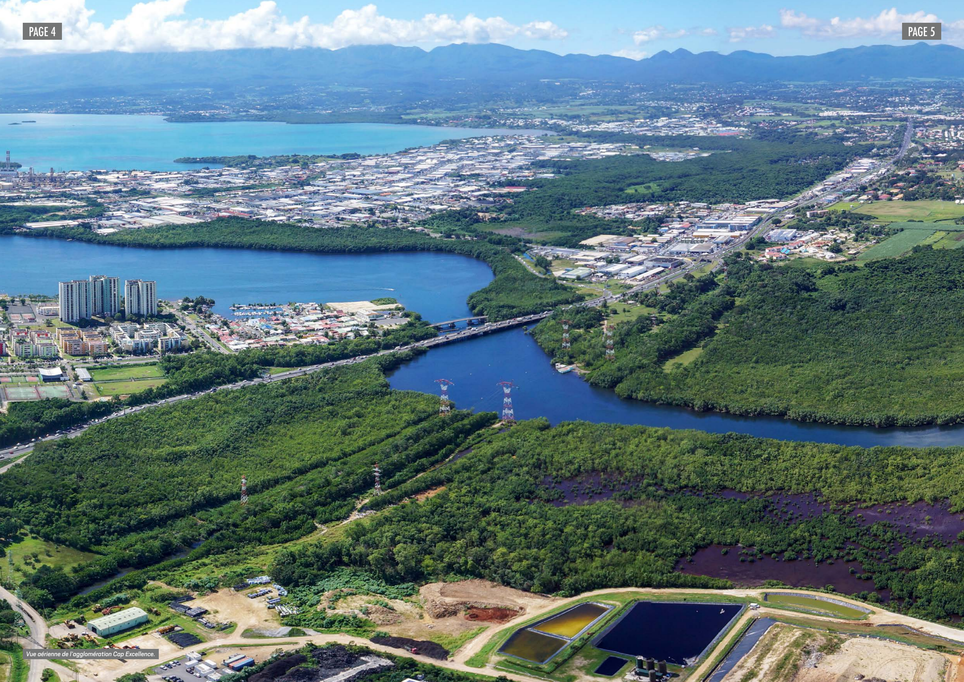
Vue aérienne de l'agglomération Cap Excellence.