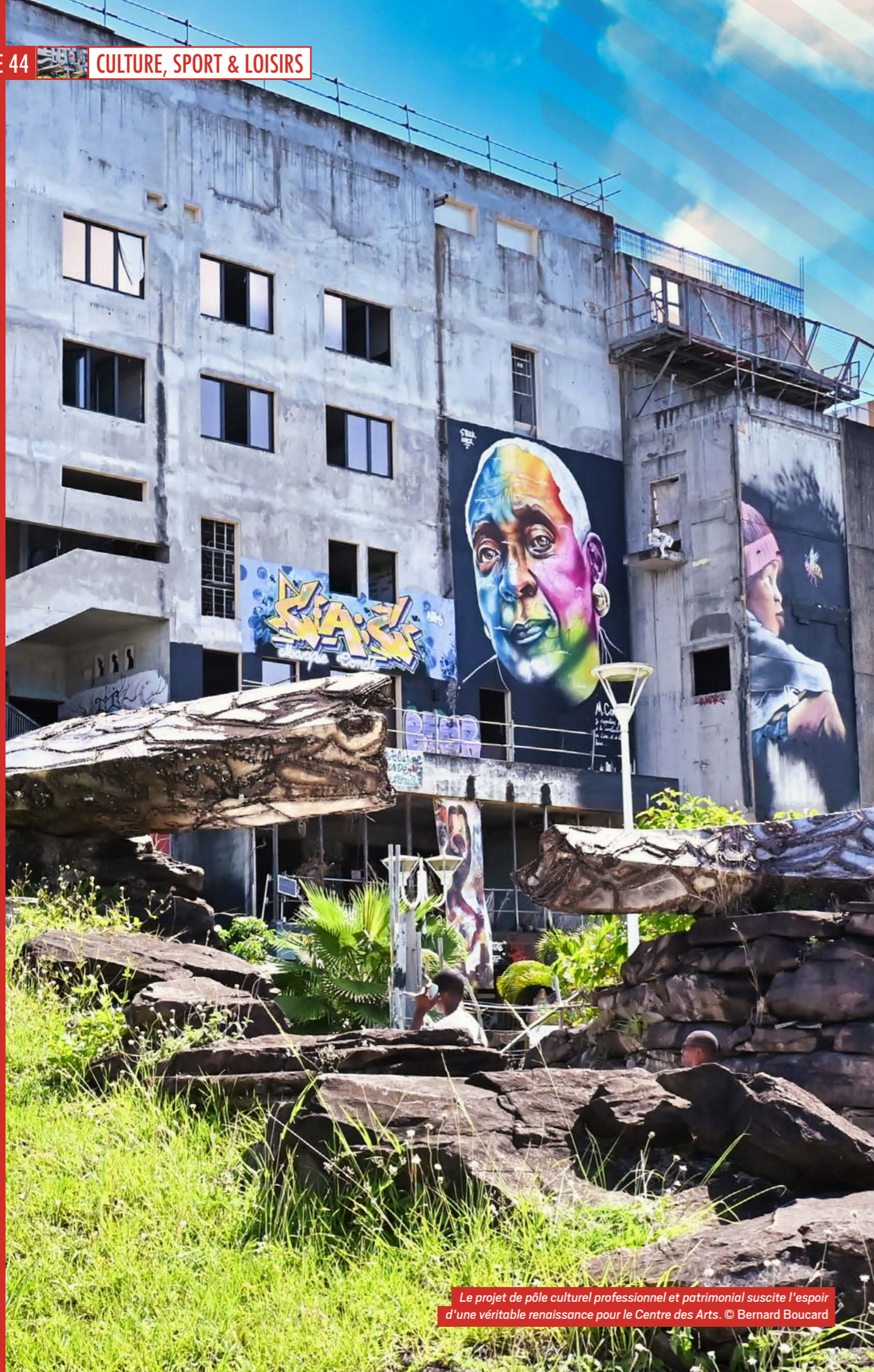
Le projet de pôle culturel professionnel et patrimonial suscite l'espoir d'une véritable renaissance pour le Centre des Arts.