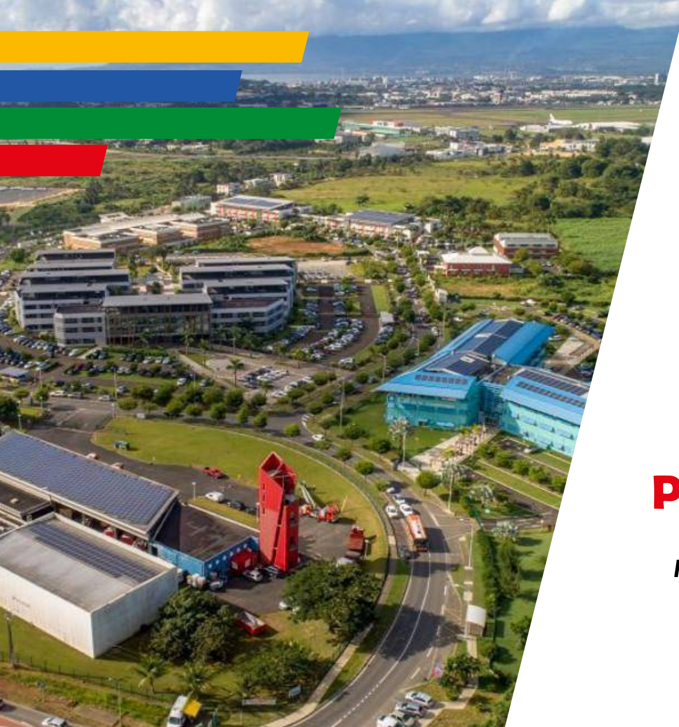
SCHÉMA DIRECTEUR DE DÉVELOPPEMENT ÉCONOMIQUE DE CAP EXCELLENCE