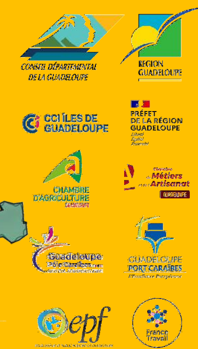
Réalisation : Métropolis, 2025