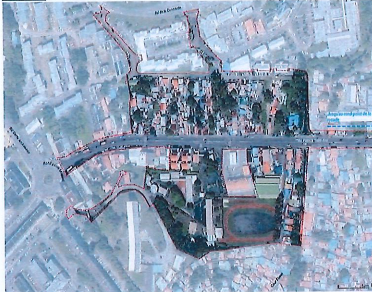
VIEUX BOURG : SITUATION ACTUELLE

Conformément à l'article 17 de la convention de mandat « gestion financière et comptable de l'opération », un compte-rendu financier (CRF) est réalisé chaque fin d'année civile afin de présenter au conseil communautaire une description opérationnelle et financière de l'avancement de l'opération.