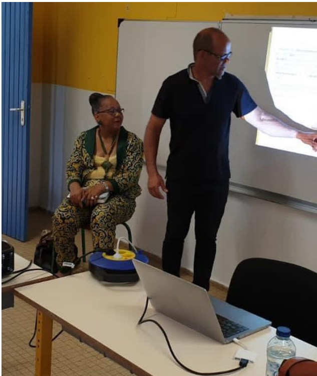
École Primaire de Chazeau – Doubs