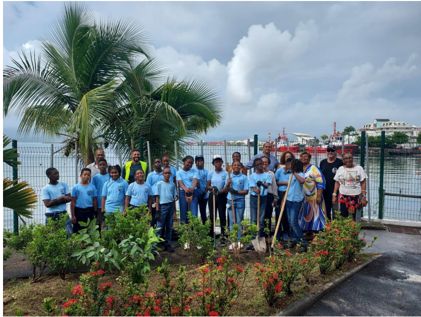
Collège Nestor de Kermadec de Pointe-à-Pitre