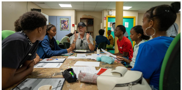
Lycée Charles Coeffin de Baie-Mahau