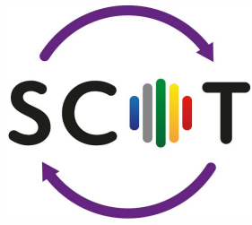
SCHÉMA DE COHÉRENCE TERRITORIALE COMMUNAUTÉ D'AGGLOMÉRATION CAP EXCELLENCE