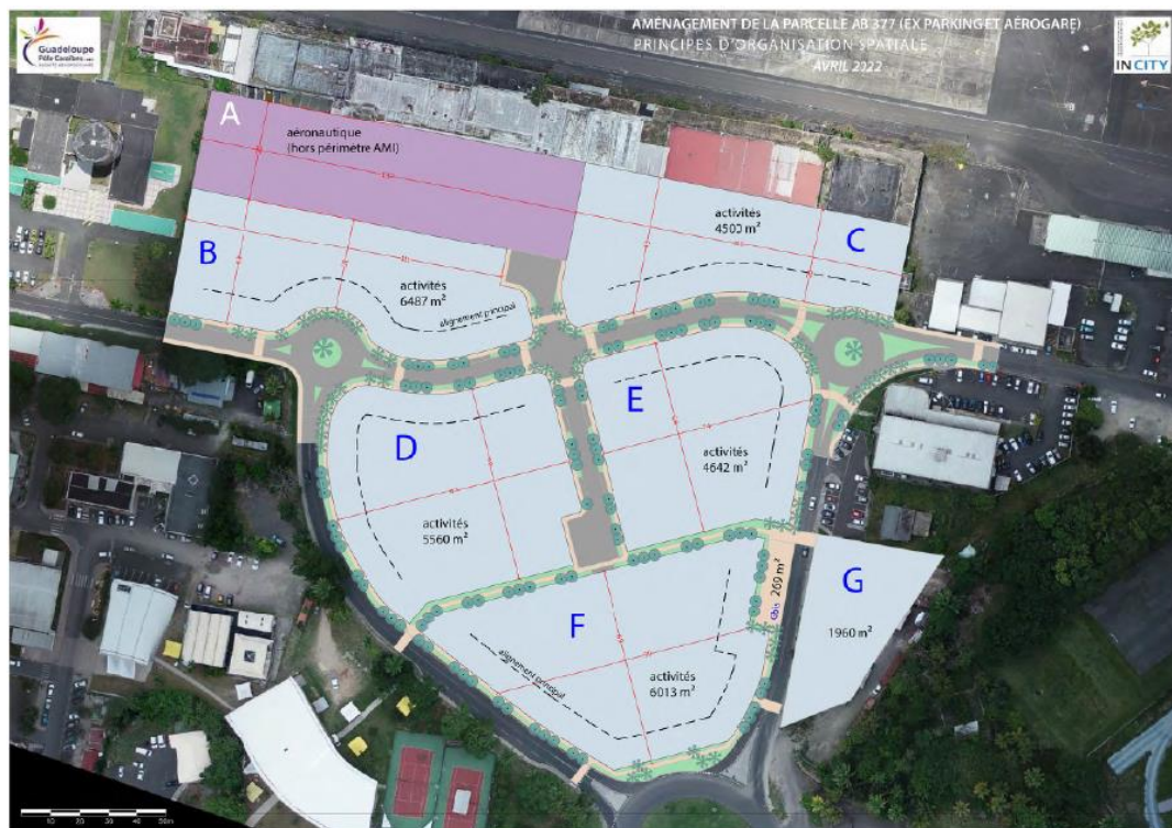
Principes d'organisation spatiale

Le projet porté par CAP Excellence se positionne sur le lot F de 6 013 m 2 .