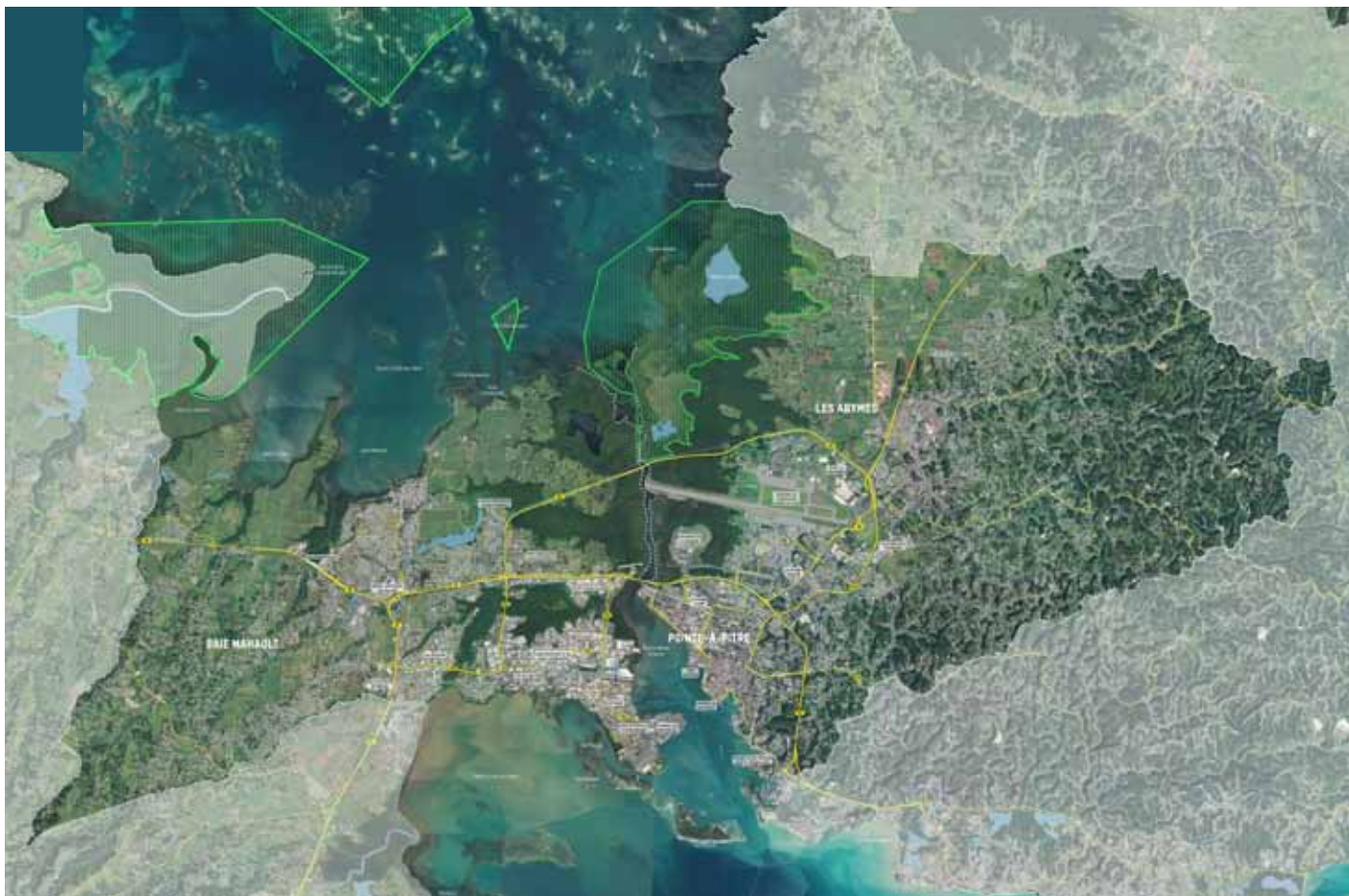
Photo aérienne du territoire de Cap Excellence - Trois communes : Les Abymes, Pointe-à-Pitre, Baie Mahaut