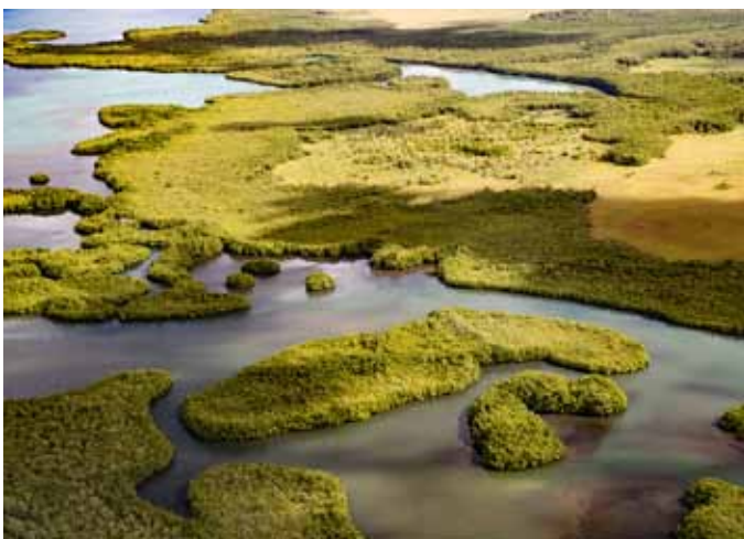
Grand Cul-de-Sac Marin, entre terres franches, forêts marécageuses, marais et mangroves.