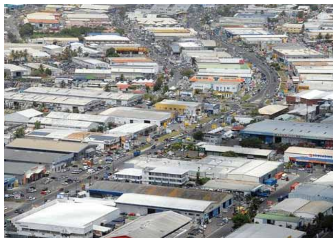
Boulevard de Houëlbourg, axe principal de Jarry