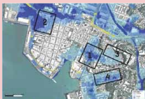
VATABLE ET CENTRE ANCIEN