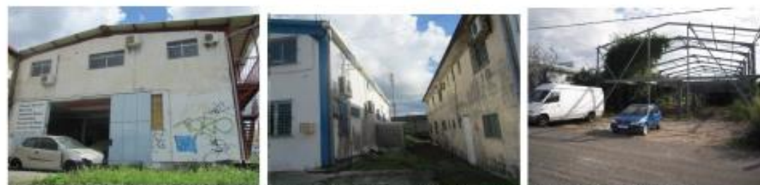
Façades en mauvais état