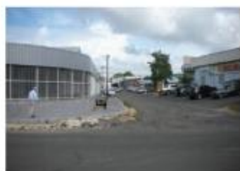
Entrée de zone Petit Pérou