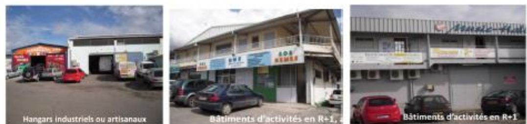
Hangars industriels ou artisanaux