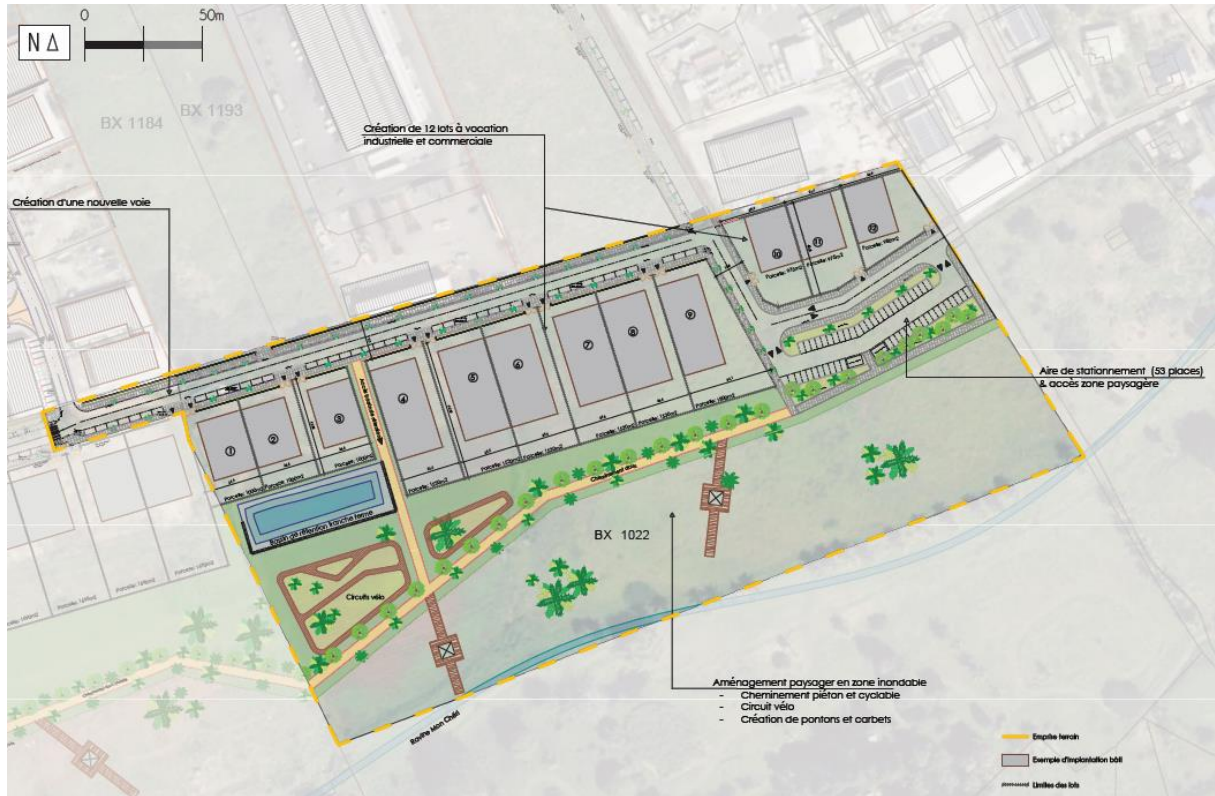
Plan du permis d'aménager (septembre 2020)