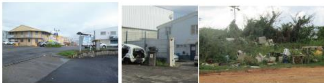
Traitement urbain absent