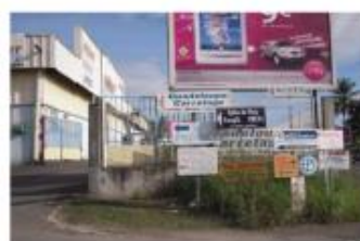
Signalisation anarchique - les pré-enseignes des entreprises se cumulent.