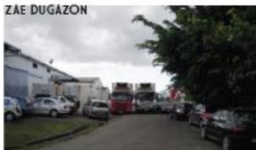
Manque de stationnement / Voies encombrées et non calibrées aux véhicules larges