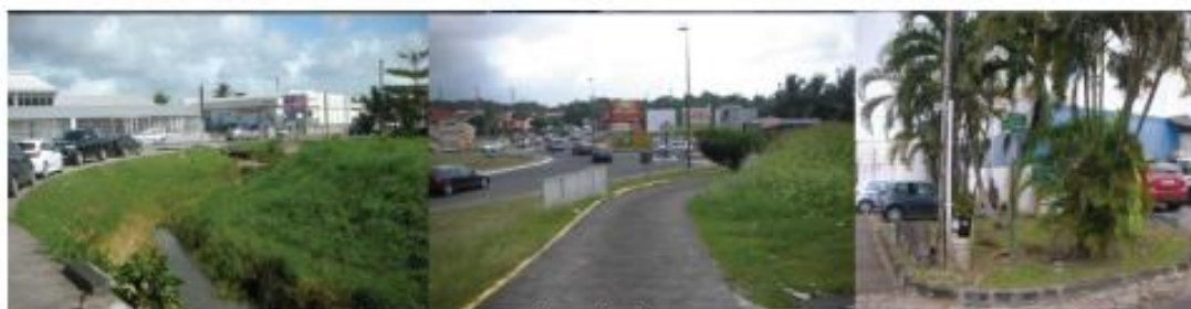
Végétation uniquement présente aux abords du site