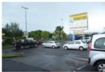
Entrée de zone Dugazon : elles sont dégagées mais peu lisibles