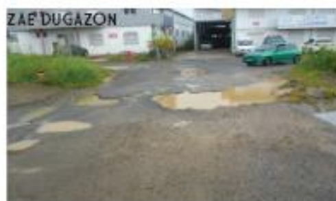
Voies inondées lors de précipitations

Par ailleurs, bien que les chefs d'entreprises implantés lui confèrent des points positifs tant par son positionnement par rapport au centre urbain de Pointe-à-Pitre que par sa proximité de la RN11, ils mettent toutefois en exergue les points qui pénalisent leur activité : parmi ces derniers, figurent principalement l'assainissement et le traitement des eaux de la zone. Ils évoquent également l'état de la voirie qui concerne moins les voies internes que les abords, bas-côtés et les jonctions entre voie publique et partie privatives.