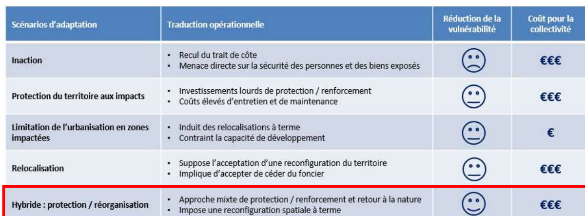
Figure 2 - Scénarii d'adaptation du PCAET de Cap Excellence

Concernant le volet « Adaptation », le scénario retenu est celui du scénario hybride entre protection et réorganisation : une approche mixte de protection du territoire, de renforcement et de retour de la nature ; de limitation de l'urbanisation en zones vulnérables ; de relocalisation, de reconfiguration spatiale à terme.